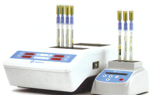
ラボ フォーマット インキュベーター Lab format Incubator